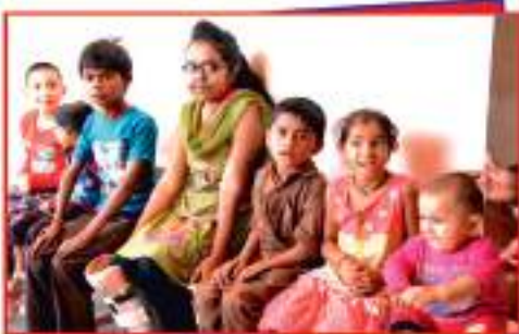
બાળ હાડકારોગના ઓપરેશન માટે સિલેક્ટ થયેલ બાળ દર્દીઓ